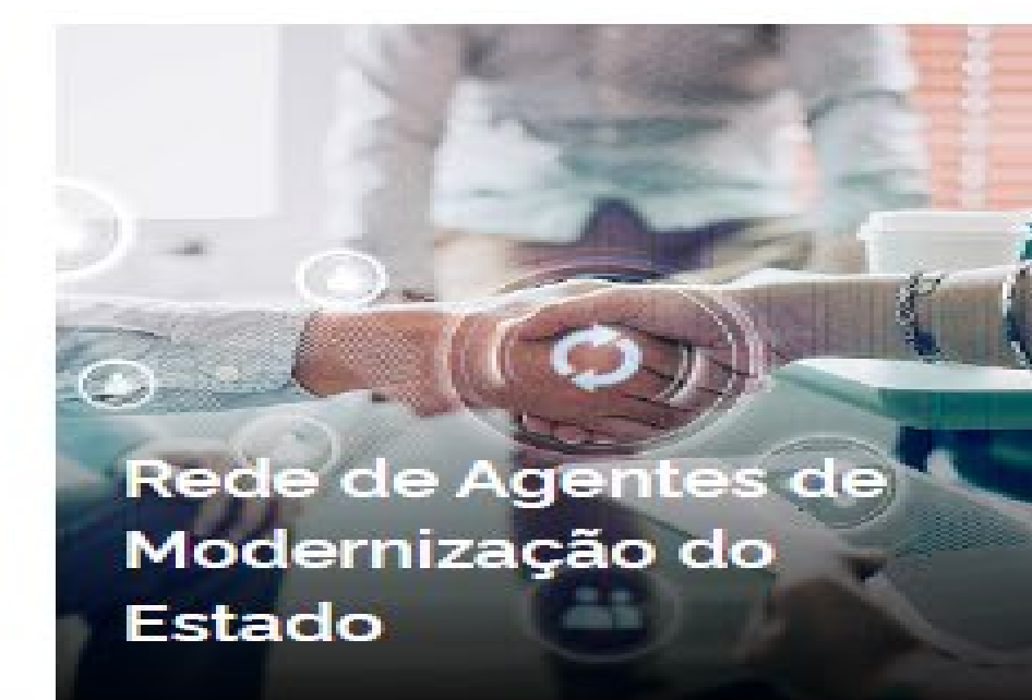
Rede de Agentes de Modernização do Estado