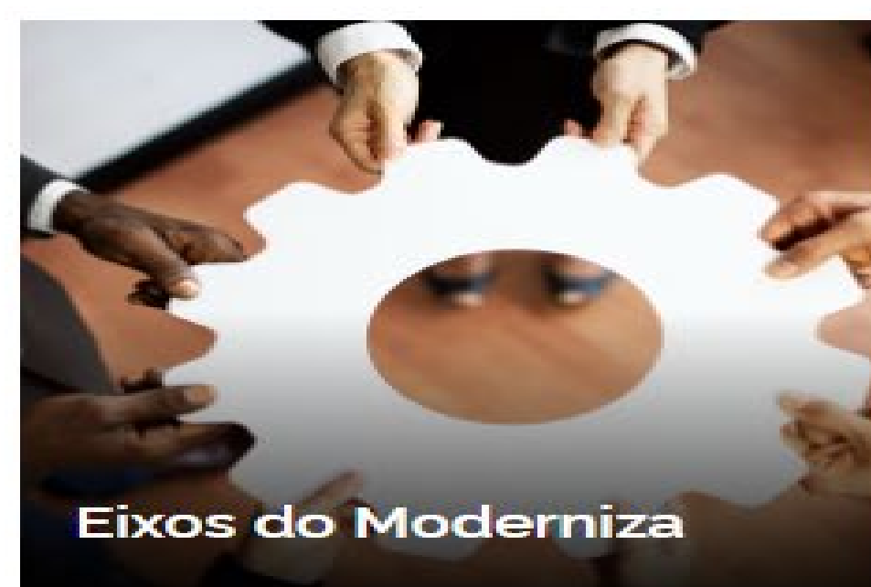
Eixos do Moderniza