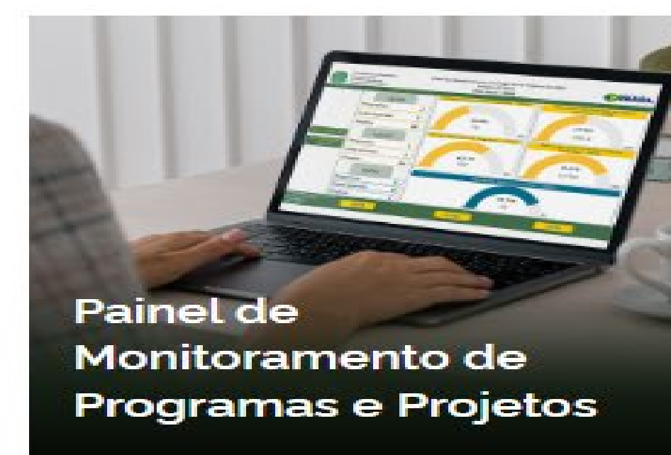
Painel de Monitoramento de Programas e Projetos